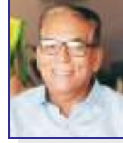
પ્રથમ મેનેજર - ગંજખાના