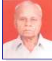
પ્રથમ સેક્રેટરી - મદનવાડ